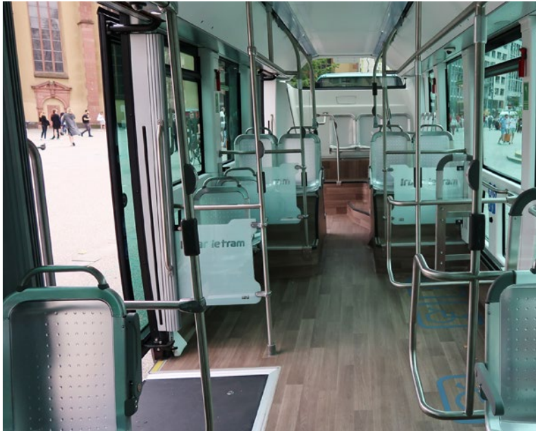
Abb. 5: Innenansicht Irizar ie tram.