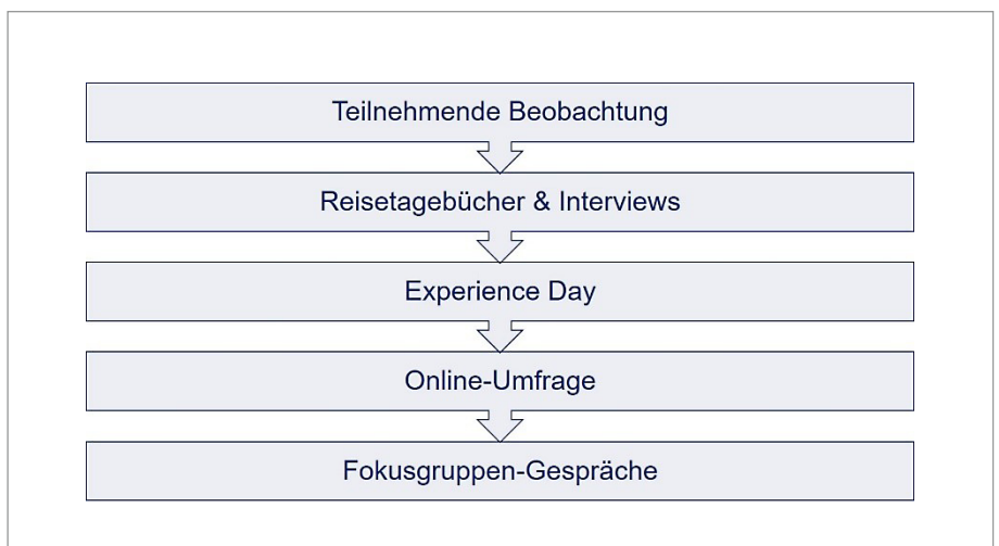
Abb. 1: Analysemethoden zur Identifizierung der Kundenwünsche an den „Bus der Zukunft“.

Parallel zu den Analysen wurden die jeweiligen Ergebnisse in mehreren internen und externen Workshops aufbereitet, auf User Journeys der stereotypisierten Nutzertypen übertragen und anschließend geschärft.